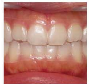
治療序盤は舌側装置