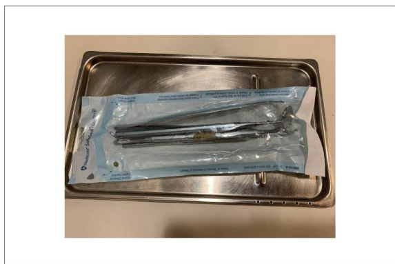
ミラー、ピンセットなどの器材を オートクレーブで完全滅菌しています