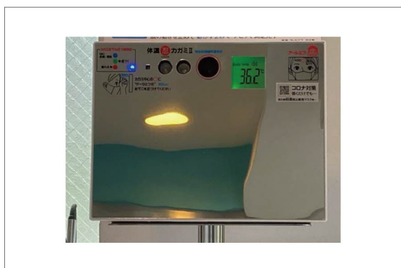
来院患者様とスタッフ全員の非接触型検温