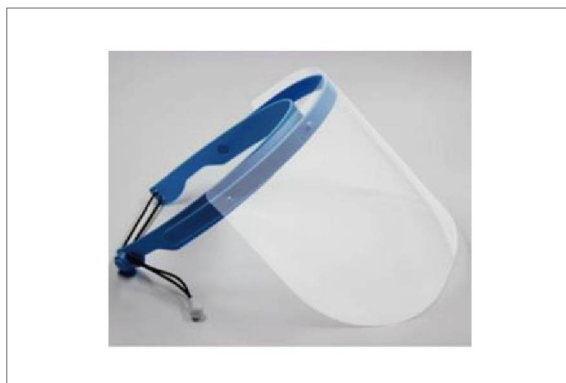
スタッフのフェースシールドの着用