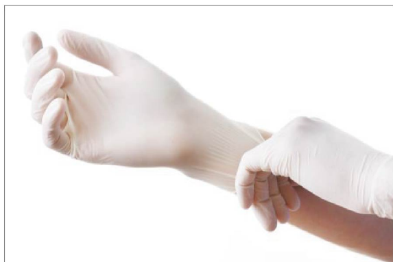
グローブを患者様ごとに交換して使用